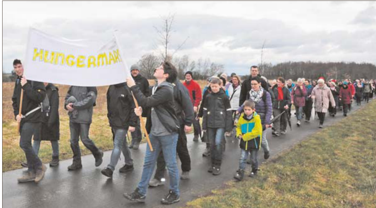
Auf den Höhen von Longkamp und Kommen fegte der Wind den Teilnehmern um die Ohren.

„Es sind so viele, die sich eingebracht haben“, ist Brucker ihnen allen sehr dankbar dafür. In besonderem Maß gilt das für die Trommler der Grundschule Monzelfeld. Sie brachten die Hungermarsch-Teilnehmer schon mehrmals rhythmisch auf den Weg. Die Schüler, die in Mali eine Patenschule unterstützen, beeindruckten mit fünf extra einstudierten Stücken. Ein weiterer besonderer Dank gilt laut Brucker den Spendern, darunter etliche, die die Projekte der Mali-Hilfe seit