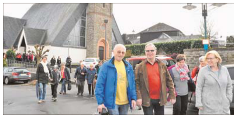
Nach dem Gottesdienst in St. Andreas ging es zum Abschluss in die Gemeindehalle Longkamp, wo eine wärmende Suppe auf die Wanderer wartete.